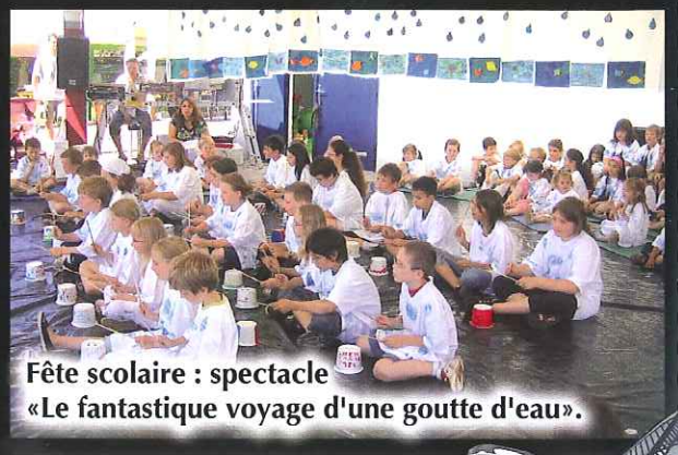
Fête scolaire : spectacle «Le fantastique voyage d'une goutte d'eau».