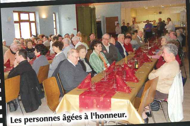
Les personnes âgées à l'honneur.