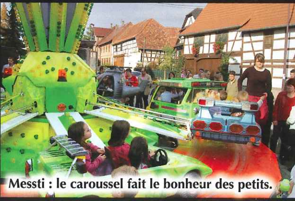
Messti : le carrousel fait le bonheur des petits.