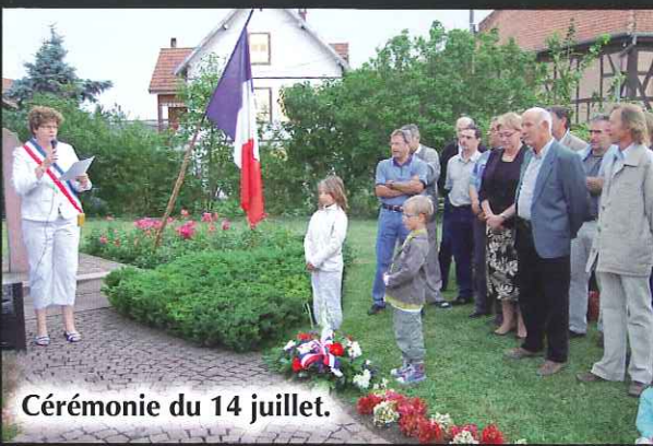
Cérémonie du 14 juillet.