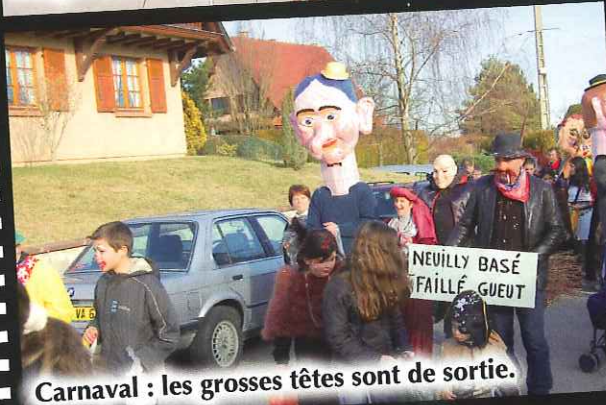
Carnaval : les grosses têtes sont de sortie.