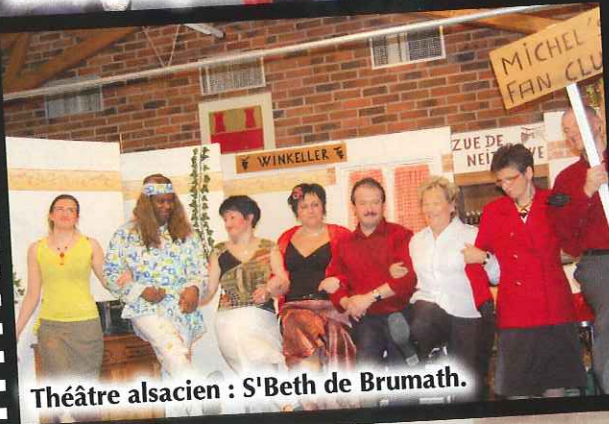
Théâtre alsacien : S'Beth de Brumath.