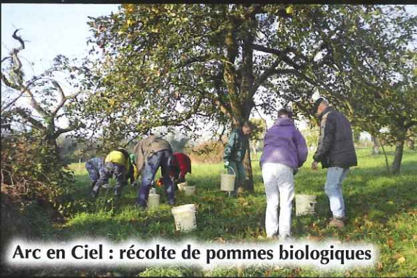
Arc en Ciel : récolte de pommes biologiques