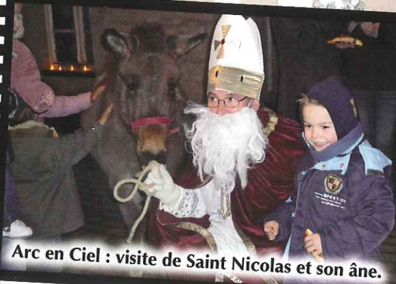
Arc en Ciel : visite de Saint Nicolas et son âne.