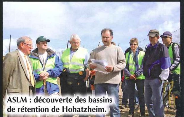
ASLM : découverte des bassins de rétention de Hohatzheim.