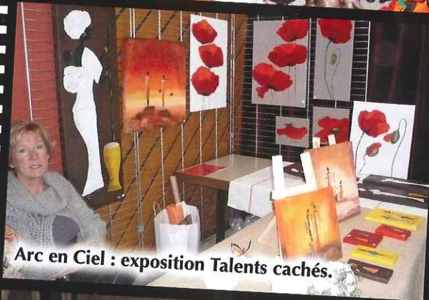
Arc en Ciel : exposition Talents cachés.