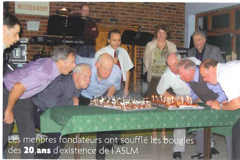
Les membres fondateurs ont soufflé les bougies des 20 ans d'existence de l'ASLM