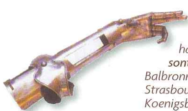
Reconstitution de la prothèse de l'avant-bras du Bailli Hans V von Mittelhausen. Trois répliques en sont conservées : à l'église de Balbronn, au Musée historique de Strasbourg, au château du Haut-Koenigsbourg.

C'est probablement Wilhelm II qui fit construire, au XV e siècle, un nouveau dispositif fortifié autour de l'église protestante de Balbronn en y intégrant la tour-habitat.