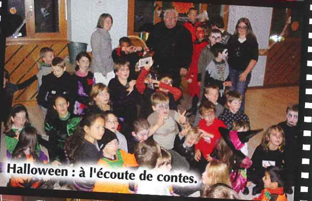
Halloween : à l'écoute de contes.