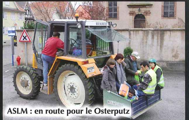
ASLM : en route pour le Osterputz